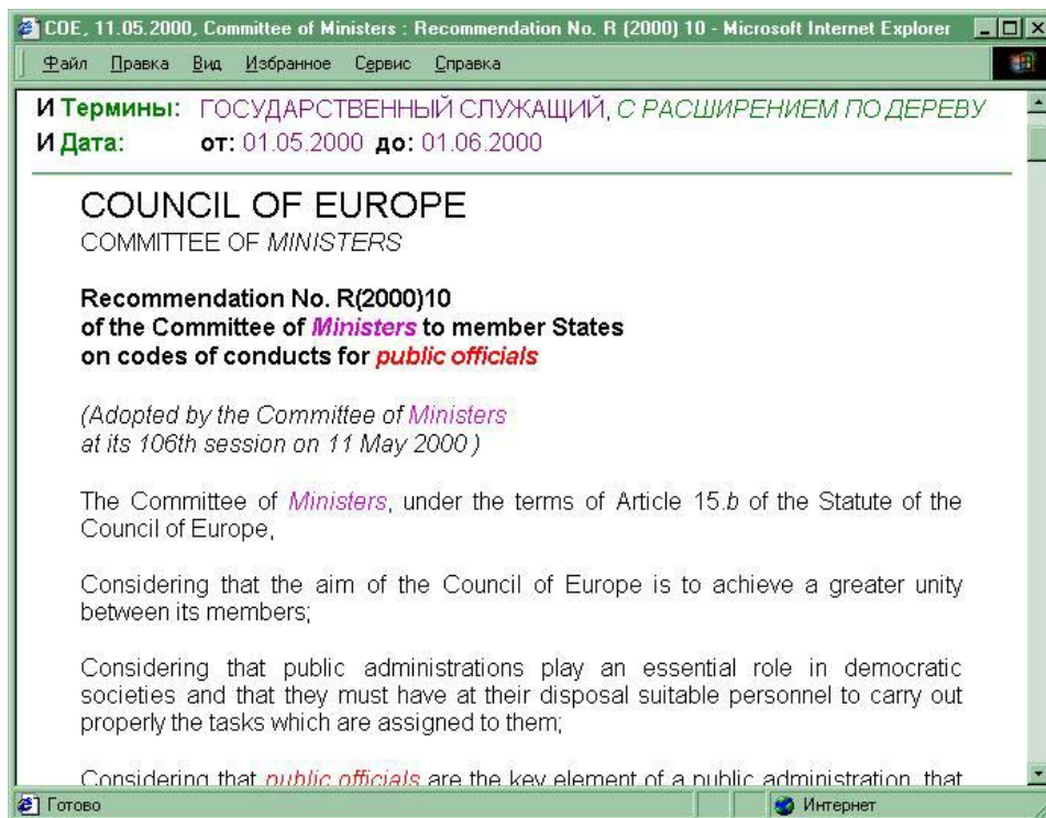
Рис.2. Обоснование результатов поиска

опцией «расширение по дереву»). В двуязычной среде эти средства приобретают новое качество – пользователь может формировать нужную ему подборку документов, работая до последнего момента в родной языковой среде.