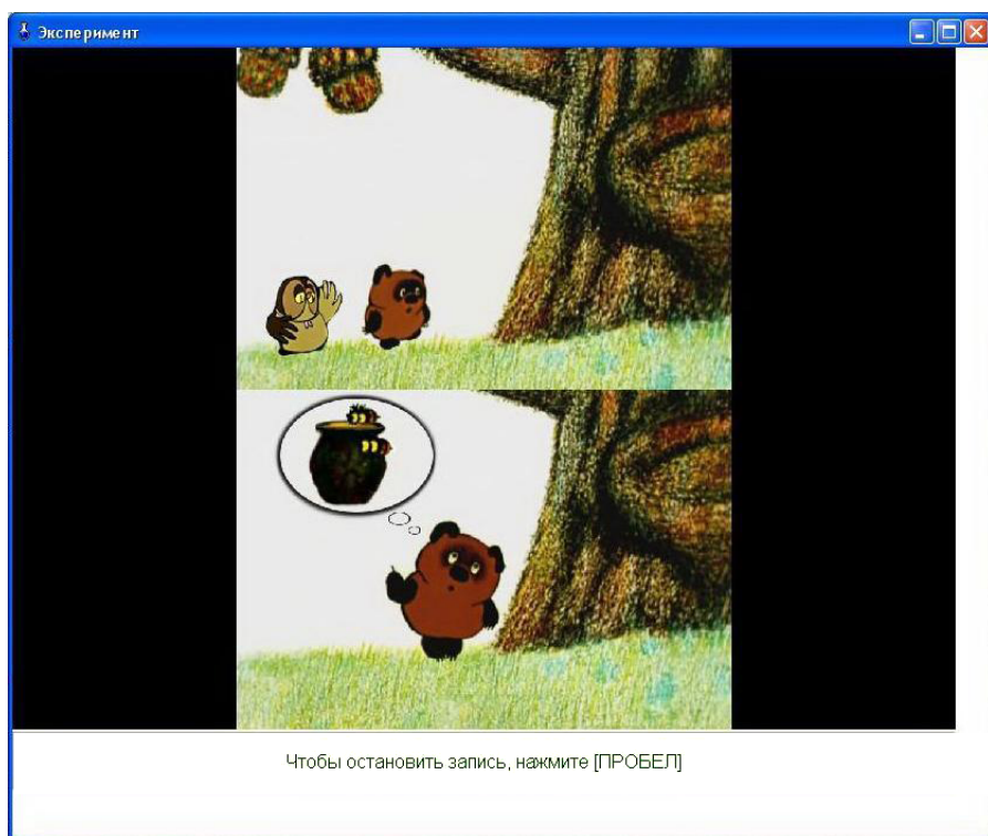
Рис. 2. Скриншот одного из сюжетов

Результаты эксперимента (см. таблицу 1) оказались очень красноречивыми — если для первого случая мы наблюдаем примерно равное количество ответов каждого типа, то в двух других испытуемые практически всегда выбирали полную ИГ.